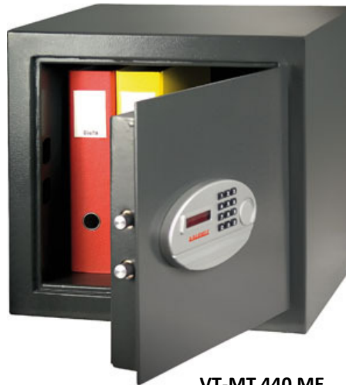
VT-MT 440 ME