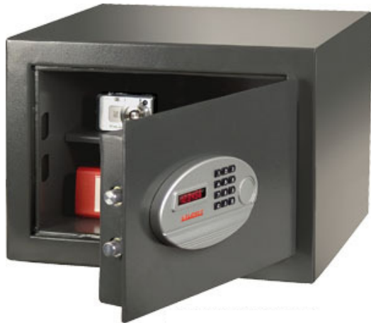
VT-MT 330 ME

Tresore mit Motorschloss für komfortable Sicherheit.