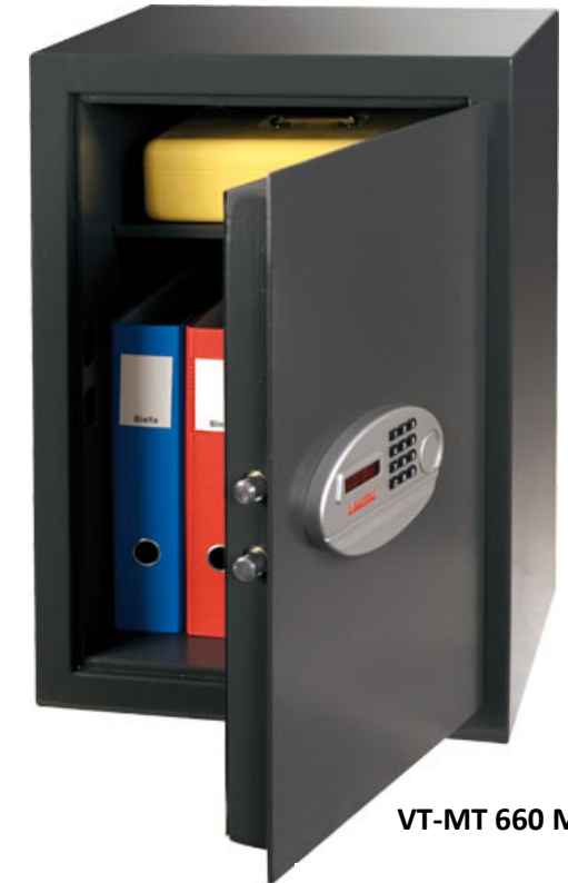
VT-MT 660 ME