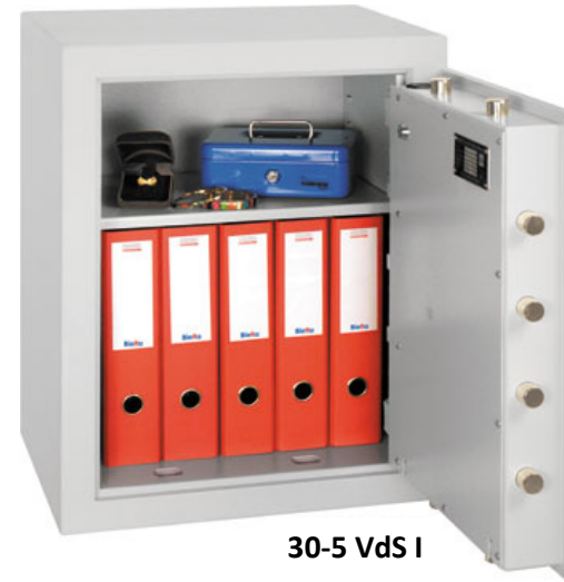
30-5 VdS I