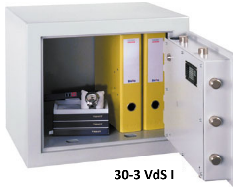
30-3 VdS I