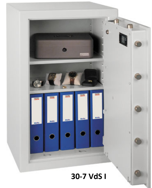
30-7 VdS I