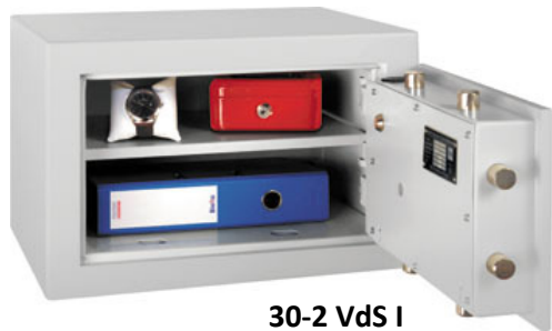
30-2 VdS I

Die klassischen Tresore für hohe Sicherheitsansprüche.